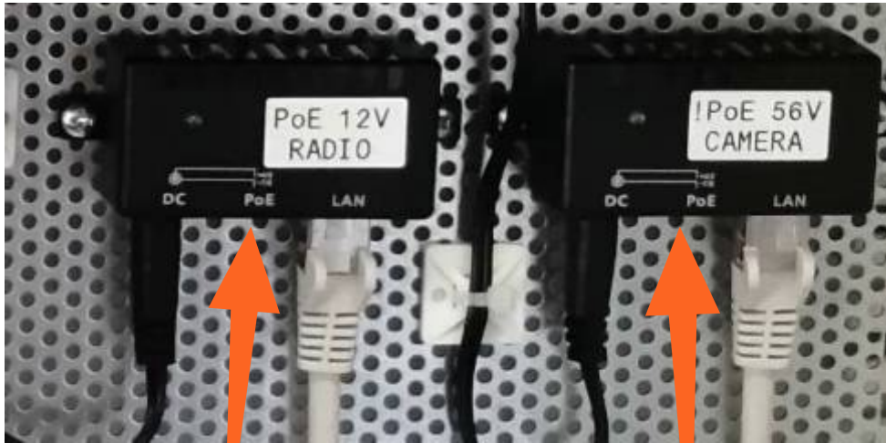
Prise Ethernet POE 12V vers radio